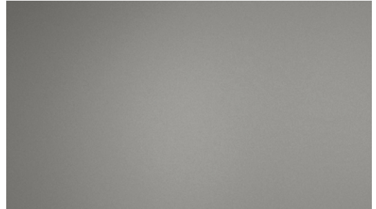
H17 Grey | Gris | Grau