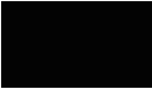
A Black | Noir | Schwarz